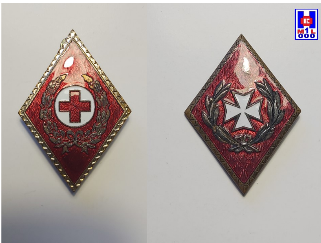
Foto 6 Similitud de rombos: a la izquierda el de Cruz Roja; a la derecha, del Cuerpo de Sanidad Militar. Solo se sustituye la Cruz de Malta del militar por la Cruz Roja. Rombos propiedad del autor

Años más tarde y según diferentes versiones: unas, las menos; para diferenciarlos del Cuerpo de Sanidad Militar ; otras, las mayoritarias, para actualizar la uniformidad a otros países de nuestro entorno y darle un aire menos castrense y con mayor identidad propia, a finales de la década de los setenta se reglamenta un nuevo (y último) uniforme, que era totalmente diferente al del Ejército, resultando de la siguiente manera: