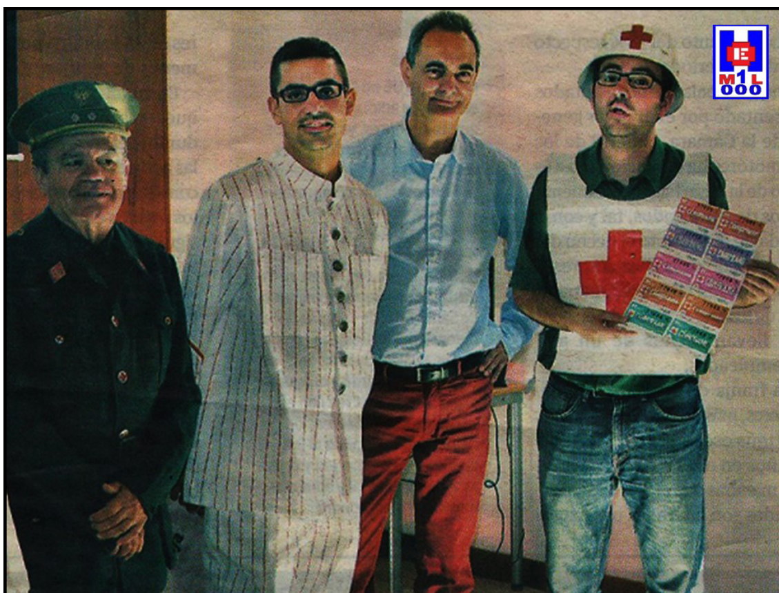
Foto 5 Diferentes tipos de uniformidad utilizadas en la Cruz Roja Española, desde su fundación hasta la actualidad, con motivo de la presentación del vídeo «Sorteo de Oro Cruz Roja Canarias».

En la década de los años 1960 (y con anterioridad) y hasta casi finales de los setenta, el uniforme de los oficiales e inspectores era el mismo que en el Ejército de Tierra, si bien con las especificidades mencionadas.