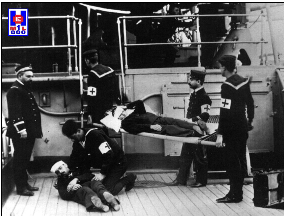
Foto 1 Sanitarios de la Cruz Roja en el Puerto de Pasajes en Gipuzkoa, 1900

Se denomina Cruz Roja Española (CRE), según su artículo uno, a «la Asociación para el Socorro a los soldados heridos en campaña, calamidades y siniestros públicos, constituida en España en 2 de marzo de 1864, cuyos vigentes Estatutos [en ese momento] han sido aprobados por el Gobierno de la República en 13 de octubre de 1931». Una vez reflejada someramente la filosofía de CRE, se desarrollarán las funciones de las tropas sanitarias de esta Institución y el papel de los profesionales que la integran.