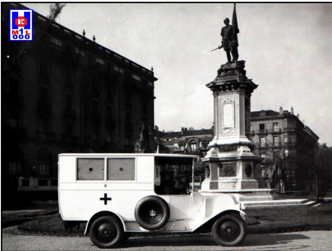
Foto 2 Ambulancia de la Cruz Roja Española en la Plaza de Okendo de San Sebastián, 1910

Este Cuerpo de Tropas de Cruz Roja estaba conformado en Brigadas Sanitarias, cada una de las cuales abarcaba una provincia determinada y tenía una numeración distintiva. Dichos cometidos –en tiempo de guerra y de paz– han sido desarrolladas con otras normas posteriores, como el Reglamento General Orgánico de la Cruz Roja Española , aprobado por la Asamblea Suprema el 17 de marzo de 1939, señalando lo siguiente: