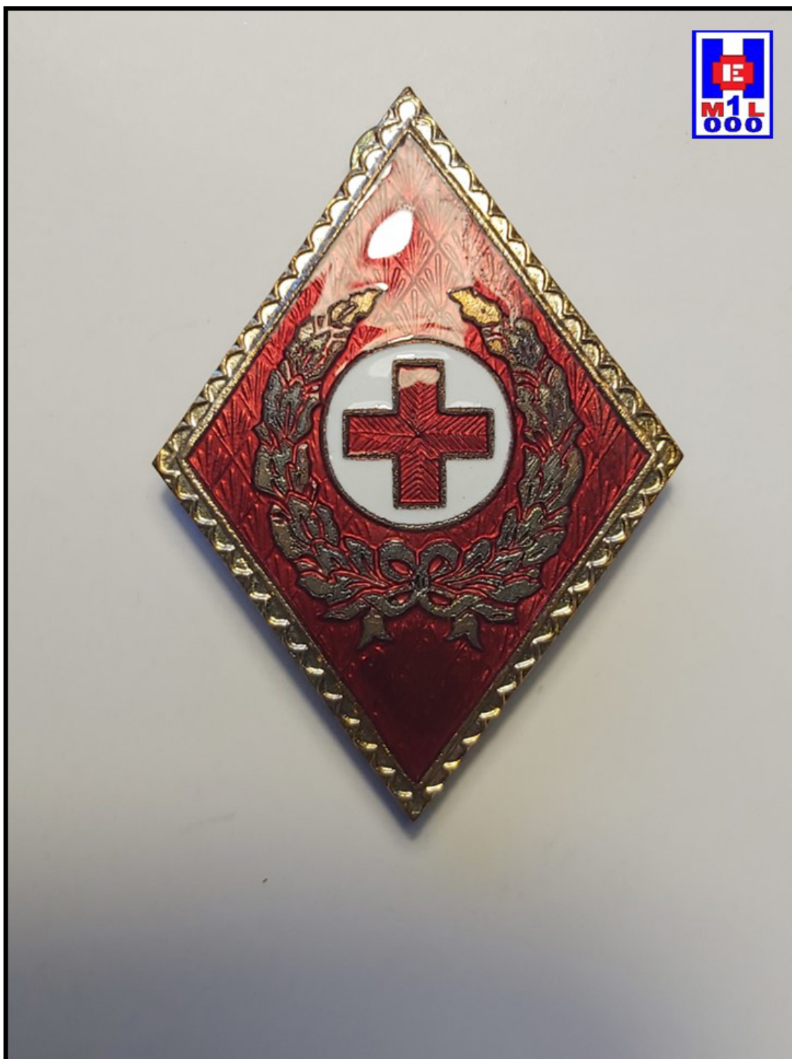
Foto 3 Rombo o losange del Cuerpo de Tropas de Socorro de CRE.

reglamentación académica y denominación fue evolucionando y cambiando, mientras que el nombre de estos profesionales sanitarios en Cruz Roja permaneció siempre igual, hasta la extinción de este Cuerpo especial en 1984.