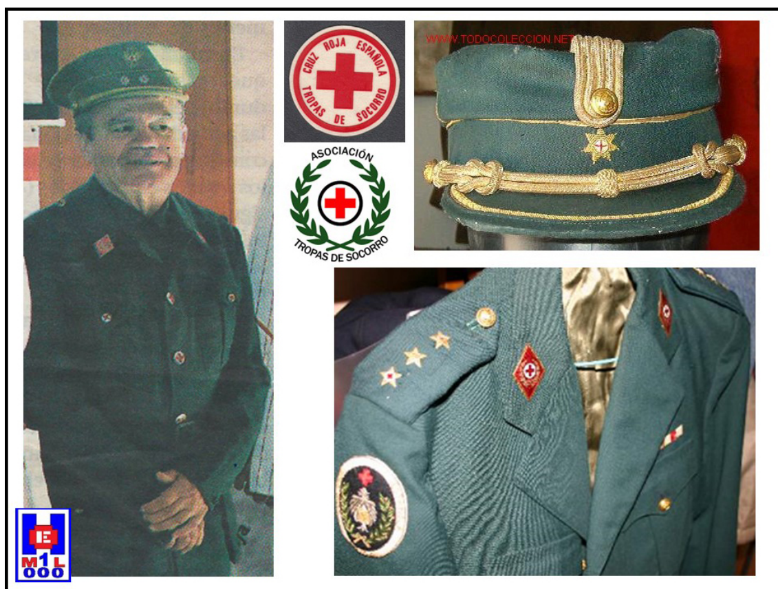
Foto 7 Detalles de uniformidad: a la izquierda, de oficial o inspector de la primera época; a la derecha, de Oficial primero (capitán) de la última etapa. Teresiana. Periódico El Día, de 6 de junio de 2014. https://tropasdesocorro.yolasite.com/brigadas-de-tropas-de-socorro.php

En 1985, desaparece el Cuerpo de Tropas de Socorro de Cruz Roja Española , por lo cual se desmilitariza Cruz Roja Española en la parte que se pudiera considerar militar, pues como se ha visto solo era considerada auxiliar del Cuerpo de Sanidad Militar en caso de guerra. Este hecho produjo malestar entre sus voluntarios, al cerrar los puestos de auxilio de mala manera, quedando la sensación de que «se desmilitarizó, pero en cambio se politizó» olvidándose de su pasado y borrando su historia militar. En la actualidad, continúa como antaño siendo financiada por sus socios y voluntarios, además de eventos tradicionales como «La Fiesta de la Banderita o los sorteos del Oro».